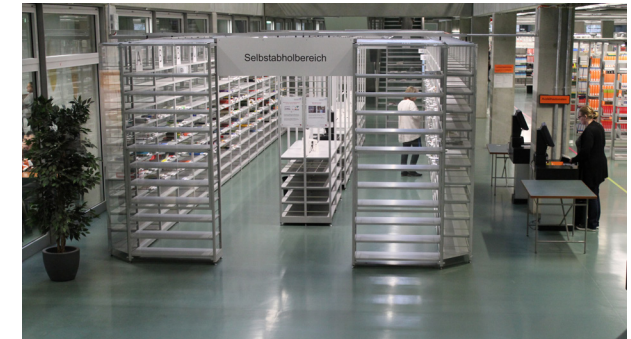
Selbstabholbereich und Ausleihautomaten im EG

Mahngebühren sind auch dann zu zahlen, wenn unser Mahnschreiben Sie nicht erreicht hat.